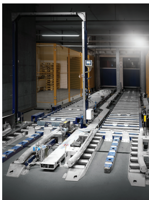
Entrée et sortie des marchandises au niveau 2 : point d'identification avec scanner, balance, vérification des palettes et du surdimensionnement.

Ce projet étant le plus gros investissement de notre entreprise depuis 25 ans, il était bien sûr particulièrement important pour nous de le mettre en œuvre avec un partenaire fiable et expérimenté. L'entreprise Jungheinrich possède cette expérience et est très professionnelle dans ce domaine. La collaboration a toujours été très bonne et les quelques problèmes que nous avons rencontrés pendant la construction ont toujours été résolus rapidement et de manière satisfaisante.