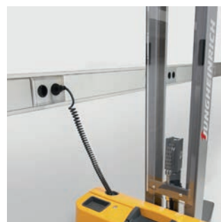
Rövid időn belül ismét üzemkész: a beépített töltőkészülék minden 230 V-os csatlakozónál újratölthető.