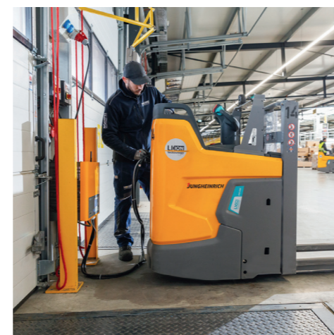
Ladestellen sind in der Umschlaghalle verteilt, um schnelles Zwischenladen zu ermöglichen. Insgesamt 30 ERD 220i sind in der 15.500 Quadratmeter großen Umschlaghalle bei Noerpel in Ulm im Einsatz.