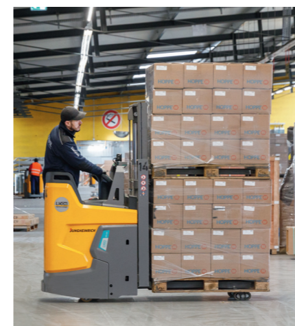
Der ERD 220i ist auch als Doppelstock einsetzbar und kann zwei Paletten übereinander transportieren. Ein erheblicher Effizienzgewinn insbesondere beim Be- und Entladen von Lkw.