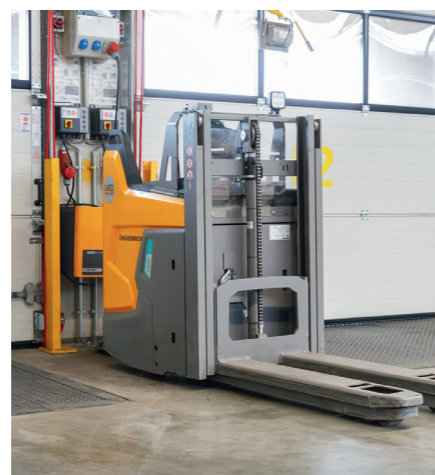
Die Ladegeräte-Software ALM regelt die Stromabgabe an den einzelnen Ladegeräten für jedes Fahrzeug individuell und verhindert teure Lastspitzen.