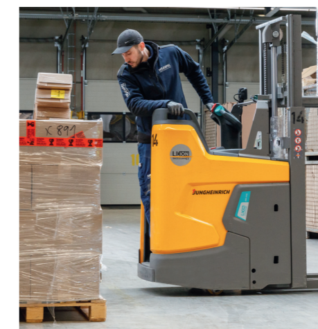
Als größter Vorteil erweist sich in der vollbepackten Umschlaghalle, dass der ERD 220i um 30 Zentimeter kürzer ist und dadurch erheblich wendiger ist als andere Fahrzeuge seiner Klasse.

insgesamt rund 2.800 Mitarbeiter. Neben nationalen und globalen Transport- und Logistiklösungen bietet das Familienunternehmen auch umfangreiche Co-Packing-Services und eine eigene Arbeitnehmerüberlassung. In Sachen Intralogistik-Lösungen verbindet Noerpel