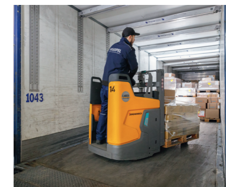
An 113 Rampen werden bei Noerpel in Ulm LKWs be- und entladen.