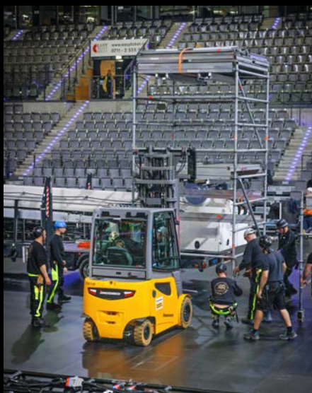
Fahrer und Bühnenhelfer arbeiten Hand in Hand zusammen.

Licht und Ton und bis zu sechs Meter lange Bühnenteile gehören zum Equipment, das für jedes Konzert auf- und abgebaut wird.