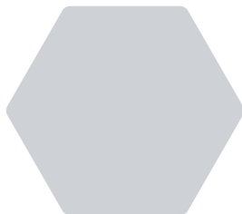
Abbildung des Lagers, Warenein- und -ausgang, Inventur, Stammdatenverwaltung, Leitstand, Host-Schnittstellen