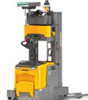
ERC 213a / 217a Mobile robot High-stack toepassingen Max. hefhoogte: 4.400 mm Max. draagvermogen: 1.700 kg