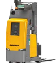
EKS 215a Mobile robot High-stack toepassingen Max. hefhoogte: 6.000 mm Max. draagvermogen: 1.500 kg