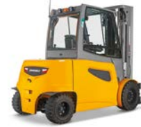
EFG 535k-550 Elektrische vierwielvorkheftruck Max. hefhoogte: 7.500 mm Max. draagvermogen: 5.000 kg