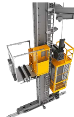
STP Magazijnkraan voor palletten Hoogteklasse: tot 40.000 mm Max. draagvermogen: 1.500 kg