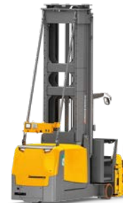
EKV 514a / 516ka / 516a Geautomatiseerde VNA-opslag Max. hefhoogte: 13.000 mm Max. draagvermogen: 1.600 kg