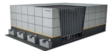
PowerCube Compact containeropslagsysteem Max. systeemhoogte: 12.000 mm Max. stapelhoogte: 33 containers Max. laadvermogen container: 50 kg