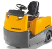
EZS 570-5100 Elektrische trekker met zitplaats Max. trekkracht: 10.000 kg