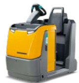
EZS 350 Elektrische trekker met staplatform Max. trekkracht: 5.000 kg