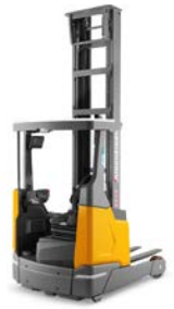
ETV 214i / 216i Reachtruck Max. hefhoogte: 10.700 mm Max. draagvermogen: 1.600 kg