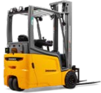
EFG 112 Elektrische driewielvorkheftruck Max. hefhoogte: 7.000 mm Max. draagvermogen: 1.200 kg