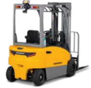
EFG BC 316-330 Elektrische vierwielvorkheftruck Max. hefhoogte: 6.500 mm Max. draagvermogen: 3.000 kg