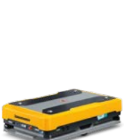
arculee M AMR Underload transport Max. lasthoogte: 2.100 mm Max. draagvermogen: 1.300 kg