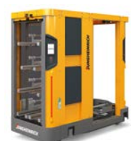
SOTO Mobile robot Handling van containers Max. aantal containers: 24 Max. gewicht container: 20 kg