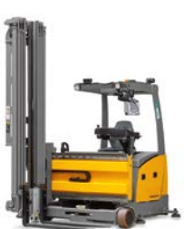
EFX 411 / 414*** Smallegangentruck man-down Max. hefhoogte: 9.000 mm Max. draagvermogen: 1.360 kg