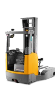
ETV Q20 / Q25 Reachtruck Max. hefhoogte: 10.700 mm Max. draagvermogen: 2.500 kg