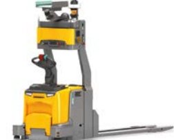
ERE 225a Mobile robot Low-level toepassingen Max. hefhoogte: 125 mm Max. draagvermogen: 2.500 kg