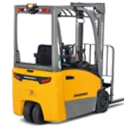
EFG BA 113 / 115 EFG BB 216k Elektrische driewielvorkheftruck Max. hefhoogte: 6.500 mm Max. draagvermogen: 1.600 kg