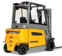
EFG 425-435 Elektrische vierwielvorkheftruck Max. hefhoogte: 7.500 mm Max. draagvermogen: 3.500 kg