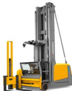
EKX 410-516k*** Smallegangentruck man-up Max. hefhoogte: 18.000 mm Max. draagvermogen: 1.600 kg