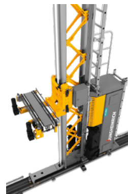
STC Magazijnkraan voor kleine goederen Hoogteklasse: tot 18.000 mm Max. draagvermogen: 2 x 50 kg