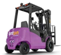
CBH 2.0 / 2.5 / 3.0 Elektrische vierwielvorkheftruck Max. hefhoogte: 4.800 mm Max. draagvermogen: 3.000 kg