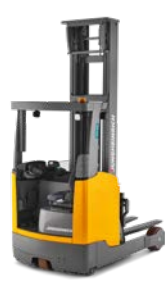
ETV 318-325 ETM 325 Reachtruck Max. hefhoogte: 14.000 mm Max. draagvermogen: 2.500 kg