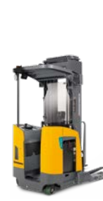
ETR 214-320 / 316d Pantograafstapelaar Max. hefhoogte: 11.354 mm Max. draagvermogen: 2.000 kg