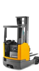
ETV C16 / C20 Reachtruck Max. hefhoogte: 7.400 mm Max. draagvermogen: 2.000 kg