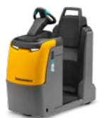
EZS 130 Elektrische trekker met staplatform Max. trekkracht: 3.000 kg