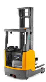
ETV 210-216 ETM 214 / 216 Reachtruck Max. hefhoogte: 10.700 mm Max. draagvermogen: 1.600 kg