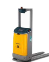
EAC 212a Mobile robot Low-stack toepassingen Max. hefhoogte: 1.200 mm Max. draagvermogen: 1.200 kg