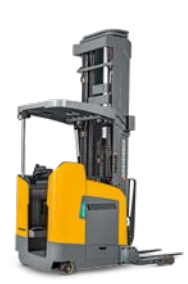
ETR 420 / 416d Pantograafstapelaar Max. hefhoogte: 13.894 mm Max. draagvermogen: 2.000 kg