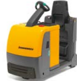
EZS C40 Elektrische trekker met staplatform Max. trekkracht: 4.000 kg