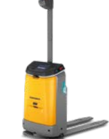
EAE 212a Mobile robot Low-level toepassingen Max. hefhoogte: 250 mm Max. draagvermogen: 1.200 kg