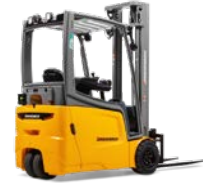
EFG 213-220 Elektrische driewielvorkheftruck Max. hefhoogte: 7.000 mm Max. draagvermogen: 2.000 kg