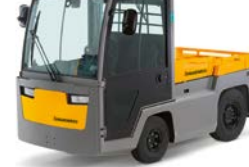
EZS 7280 Elektrische trekker met zitplaats Max. trekkracht: 28.000 kg