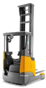
ETV 314i-325i Reachtruck Max. hefhoogte: 14.000 mm Max. draagvermogen: 2.500 kg