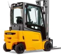
EFG 316-320 Elektrische vierwielvorkheftruck Max. hefhoogte: 7.000 mm Max. draagvermogen: 2.000 kg