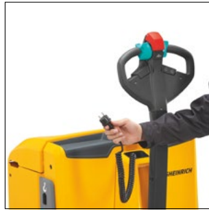
Cargador integrado (opcional)