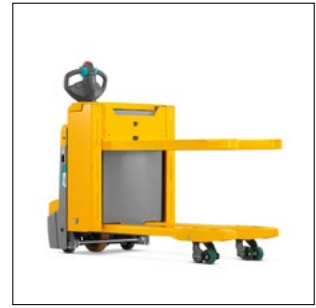
Posición de trabajo ergonómica