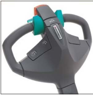
Cabezal de barra timón ergonómico