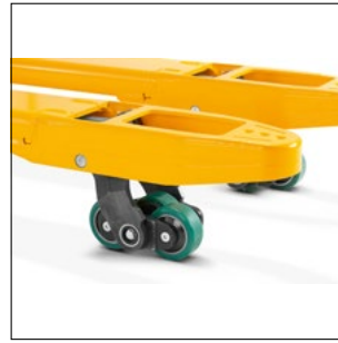
Rodillo de carga triple