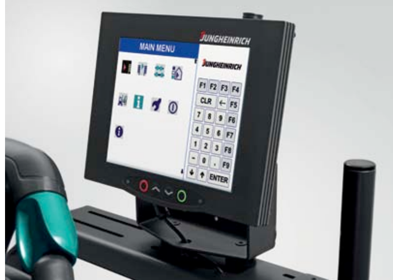
Sezgisel olarak kumanda edilebilen veri terminali