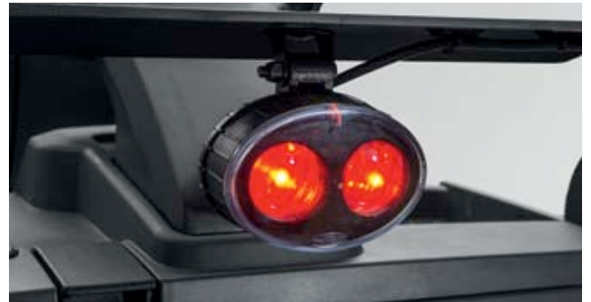
Güvenli manevra için Floor-Spot

Belirsiz veya dar depo alanlarında Floor-Spot diye adlandırılan iyi görülebilir bir kırmızı ışık noktası, ek bir güvence sağlar. Bu, aracın önüne 3 m'lik bir mesafede sürüş yolunun üzerine yansıtılır.