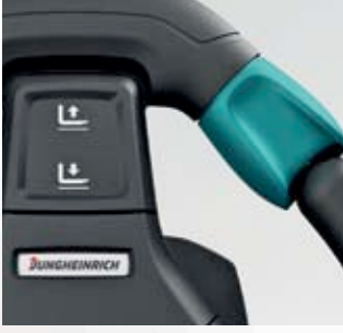
JetPilot işletme tuşları