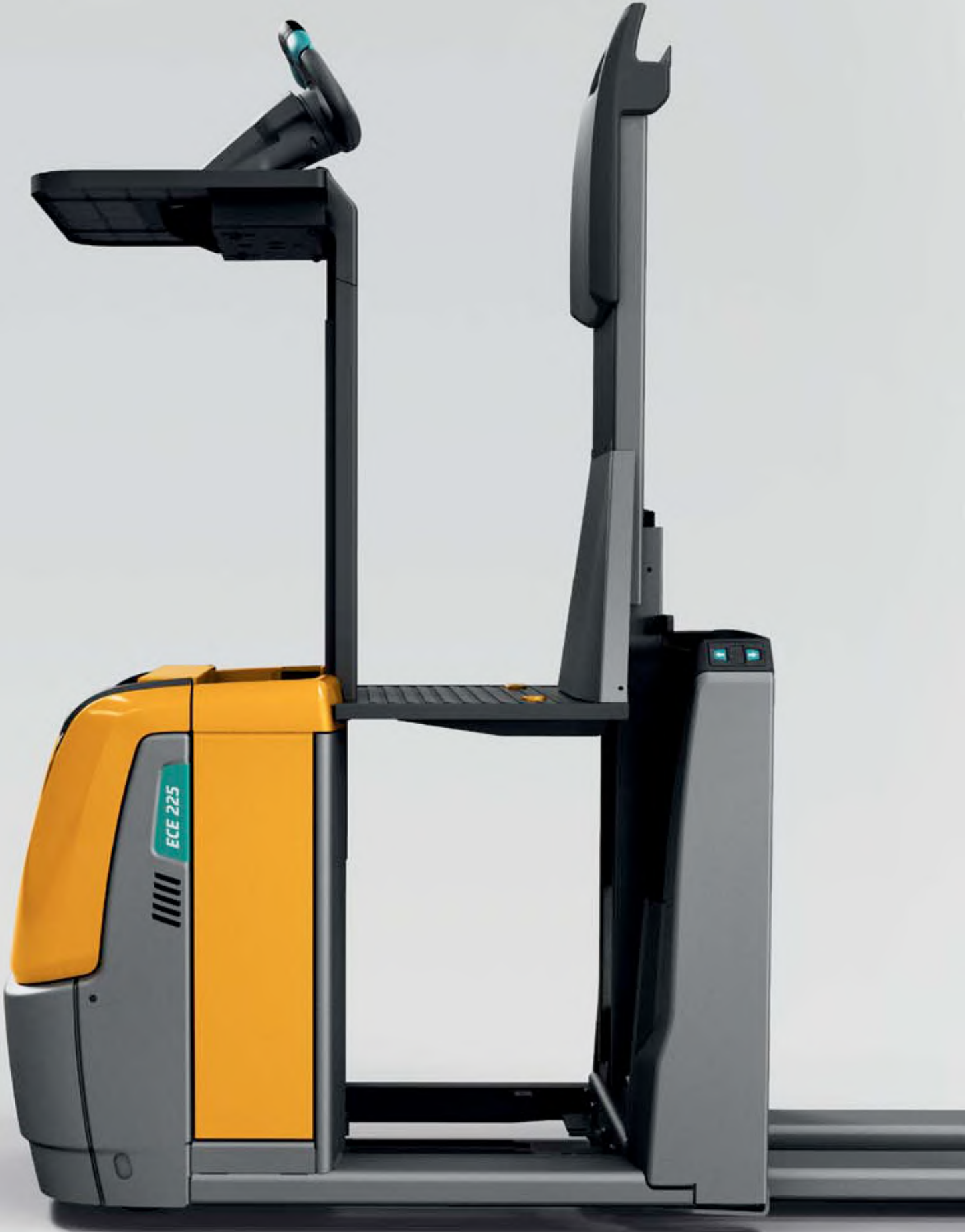
Kumanda ünitesi kaldırılabilir platform (HP-LJ)