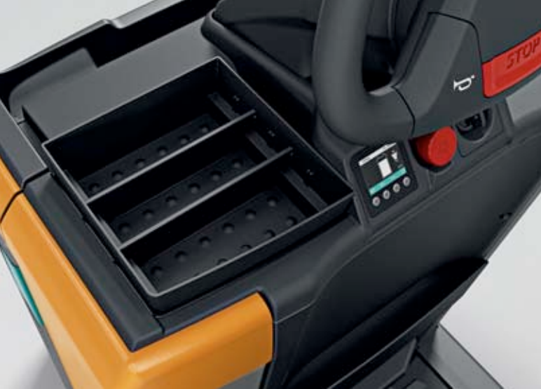
Opsiyonel modüler eşya gözü

Sipariş toplama ekipmanınızın tüm gücünden faydalanmak ve toplama oranlarını en üst düzeye getirmeye devam etmek için tüm opsiyonları biliyor musunuz? Biz işinizi kolaylaştırıyoruz. Sipariş toplama ekipmanınızın kullanım talebinize göre %100 uyarlanmasını sağlamak için çok çeşitli, faydalı opsiyonlar ve çok sayıda ek donanımlar sunuyoruz.