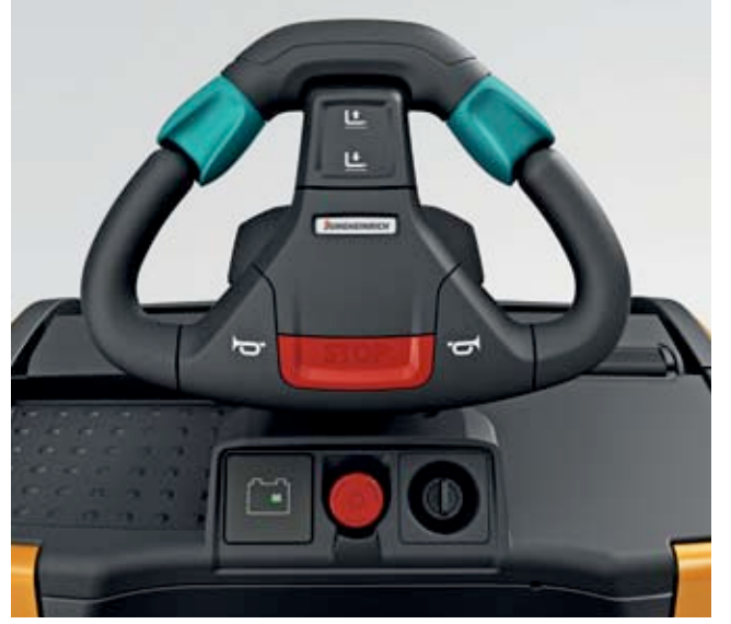
JetPilot: Yüksekliği ayarlanabilen çok fonksiyonlu direksiyon