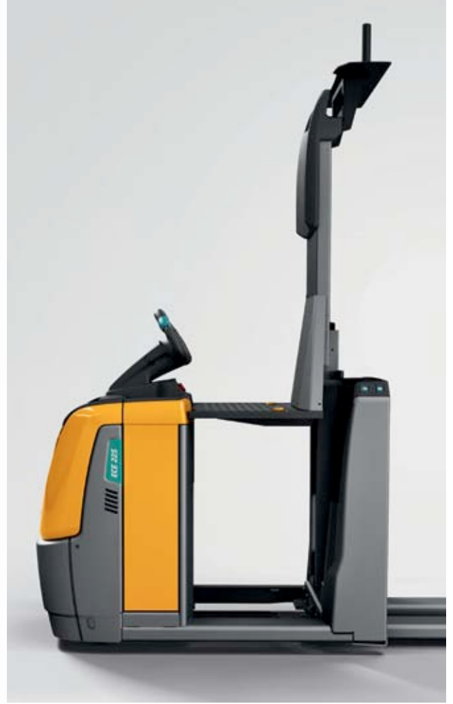
Kaldırılabilir platform (HP)

İkinci raf seviyesinde sıklıkla yapılan sipariş toplama işlemi için hidrolik kaldırılabilir platformumuz, zaman açısından en uygun ve ergonomik çalışma için gerekli kaldırma özelliđini sunuyor. Platformun kaldırılması ayak tuşu ile yapılır, böylece operatörün elleri boşta kalır.