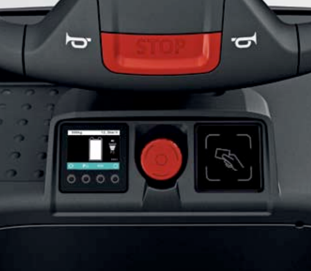
Renkli 2 inç ekran ve EasyAccess-Transponder