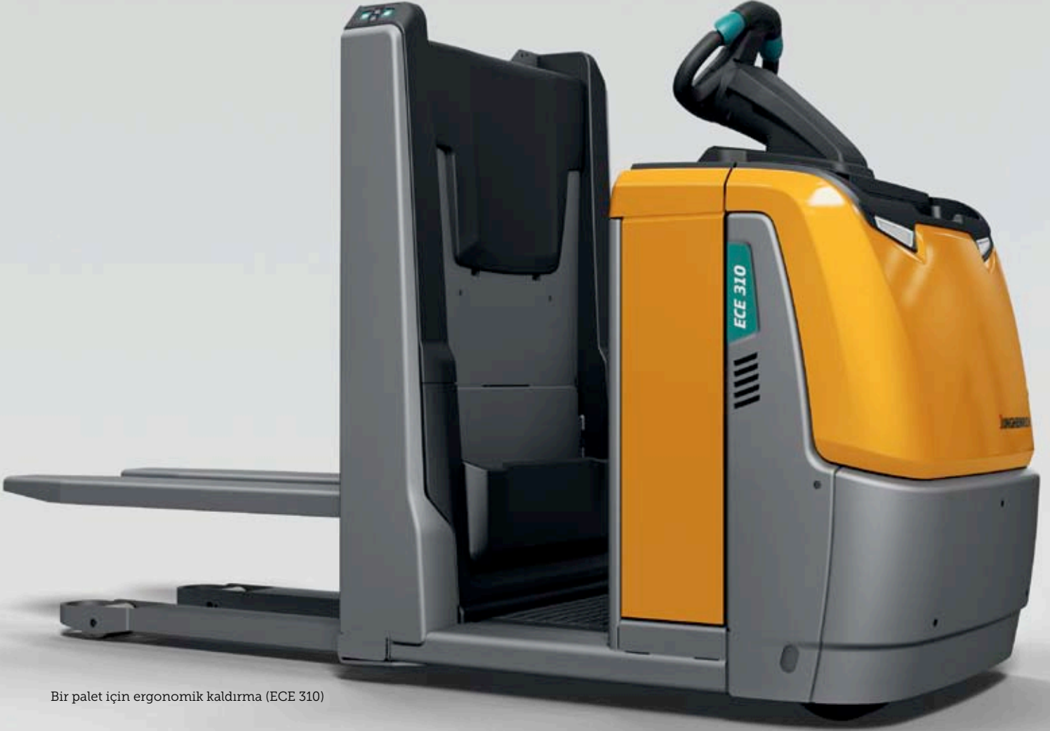
Bir palet için ergonomik kaldırma (ECE 310)