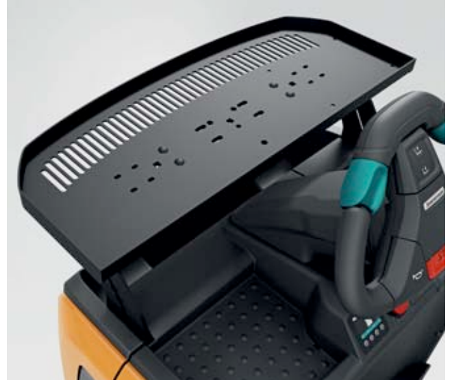
Opsiyonel sipariş gözü