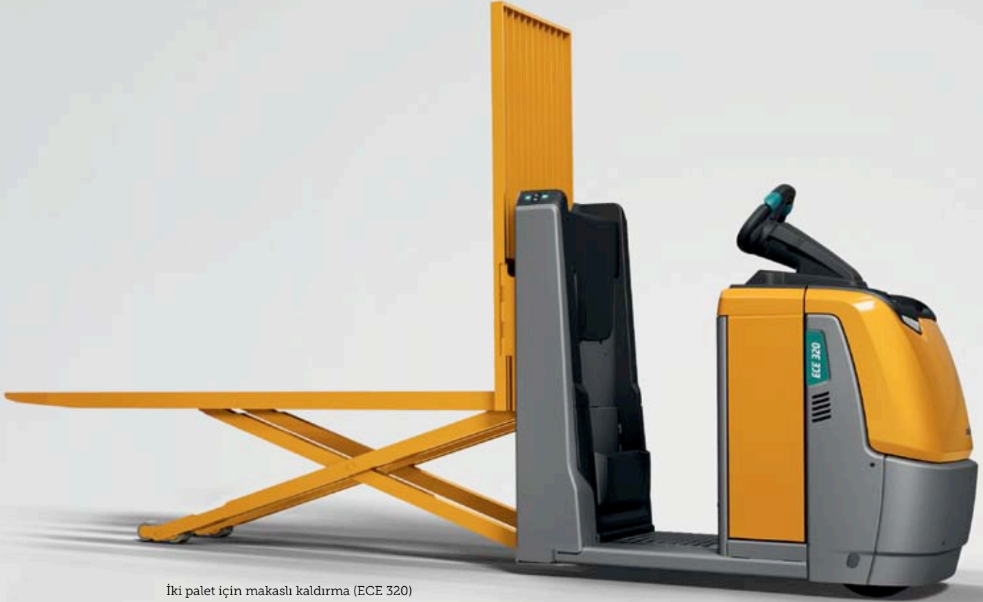
İki palet için makaslı kaldırma (ECE 320)