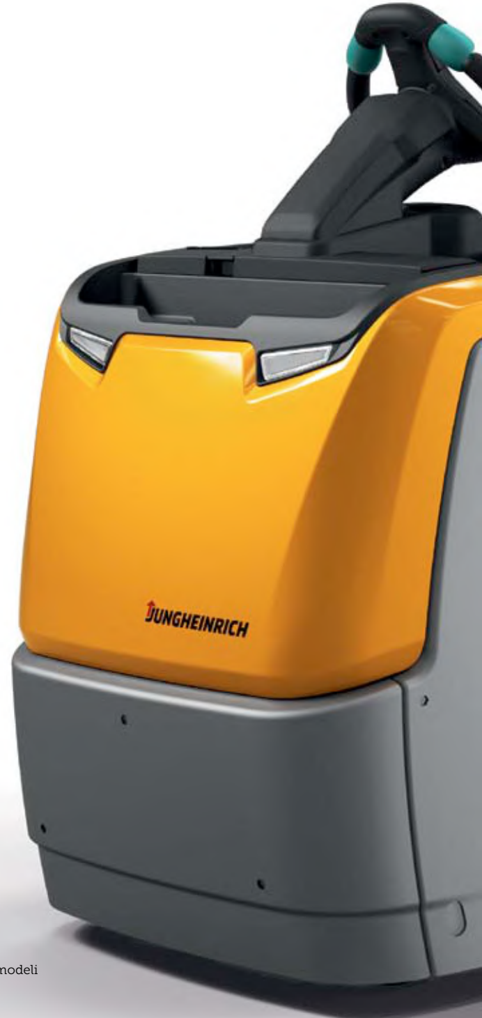
ECE 2 serisi standart modeli

ECE sipariş toplama ekipmanlarımız güçlü performansı ve yüksek kaliteli tasarımı, sağlam işçilikle birleştirir: Darbeye karşı korumalı ön kapak ve 2.500 kg'a kadar taşıma kapasiteleriyle en zorlu kullanım durumlarına karşı hazırlıklıdır.