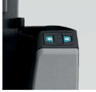
Sırt desteği işletme tuşları