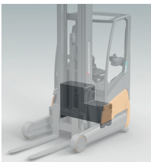
Batterie lithium-ions intégrée

Le chariot à mât rétractable ETV 216i, premier chariot à mât rétractable du monde équipé d'une batterie lithium-ions intégrée, est la dernière preuve de la force d'innovation de Jungheinrich. Grâce à sa batterie lithium-ions intégrée, l'ETV 216i est le chariot le plus compact et le plus performant de sa catégorie. Cela permet de profiter d'une meilleure ergonomie, d'une plus grande maniabilité et d'une plus grande efficacité.