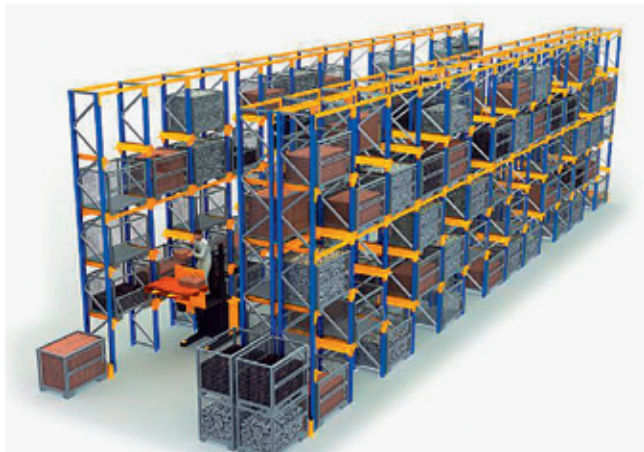
Jednomiestny regál od Jungheinrich

Spoločnosť Jungheinrich je známa ako popredný výrobca kvalitnej manipulačnej techniky, svojim klientom však poskytuje aj komplexné end-to-end riešenia pre regály a skladovanie. Zákazníci tak pod jednou strechou môžu vyriešiť skladové regály aj manipulačnú techniku.