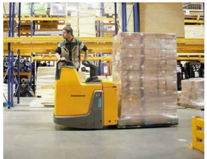
De ERE is dankzij de vaste zijwanden comfortabeler en veiliger.

Op zijn advies kwam bijvoorbeeld de ERE palletwagen in beeld. Heeres: "Zelf hadden we niet direct gedacht aan een vast plateau met zijwanden, maar het biedt absoluut voordelen. Er worden toch lange afstanden afgelegd. Dankzij de vaste zijwanden staan onze mensen comfortabeler en veiliger. Bovendien zijn we een werkleerbedrijf en is het goed als onze mensen kennismaken met verschillende typen trucks. Zo kunnen ze straks optimaal voorbereid de arbeidsmarkt op." ■