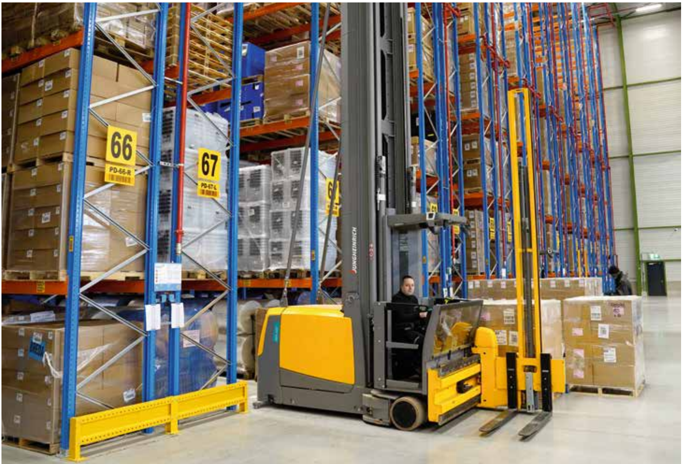
De nieuwe combitrucks bij Claassen Logistics slaan de pallets op tot een hoogte van 17,8 meter.

De keuze om het letterlijk hoger op te zoeken, is een gevolg van de beschikbare grond naast het bestaande warehouse en van de stijgende vierkante meter prijs. "Naarmate de grond duurder wordt, zal het voor steeds meer bedrijven een interessante optie zijn om de hoogte in te gaan", voorspelt Huib. De keuze heeft Claassen Logistics in ieder geval geen windeieren gelegd. Door de goederen op bijna 18 meter weg te zetten, kunnen op hetzelfde oppervlak niet 25.000, maar 37.000 pallets worden opgeslagen. Een winst van 12.000 pallets.