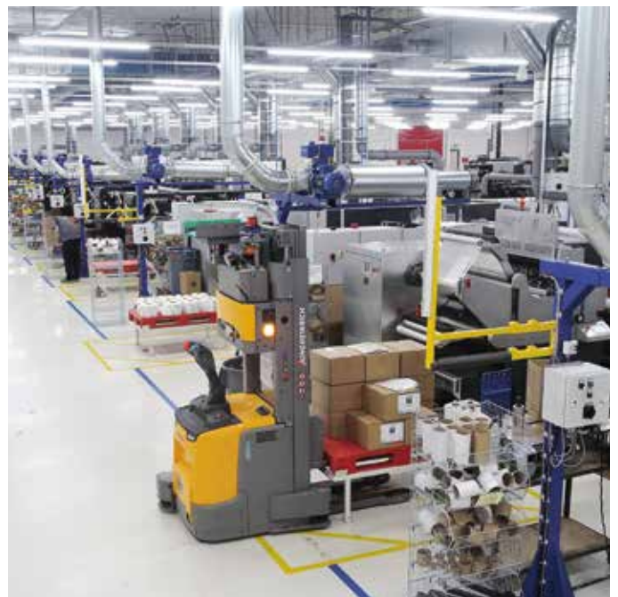
De AGV haalt na een druk op de knop de volle pallet op bij een werkstation.