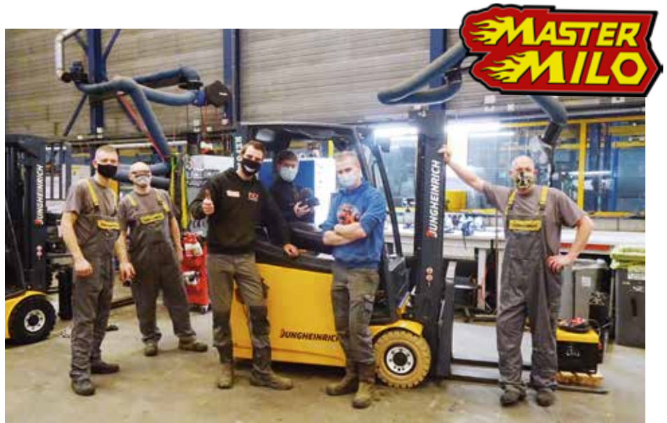
Samen met de Jungheinrich-monteurs reviseerde MasterMilo zijn gloednieuwe gebruikte heftruck.

Om de techniek van een heftruck beter te begrijpen, hielp MasterMilo mee aan de revisie van zijn eigen heftruck. De heftruck werd compleet gedemonteerd, gecontroleerd en opgeknapt. Het chassis werd geschuurd en kreeg een nieuwe laklaag en de accu werd nagekeken