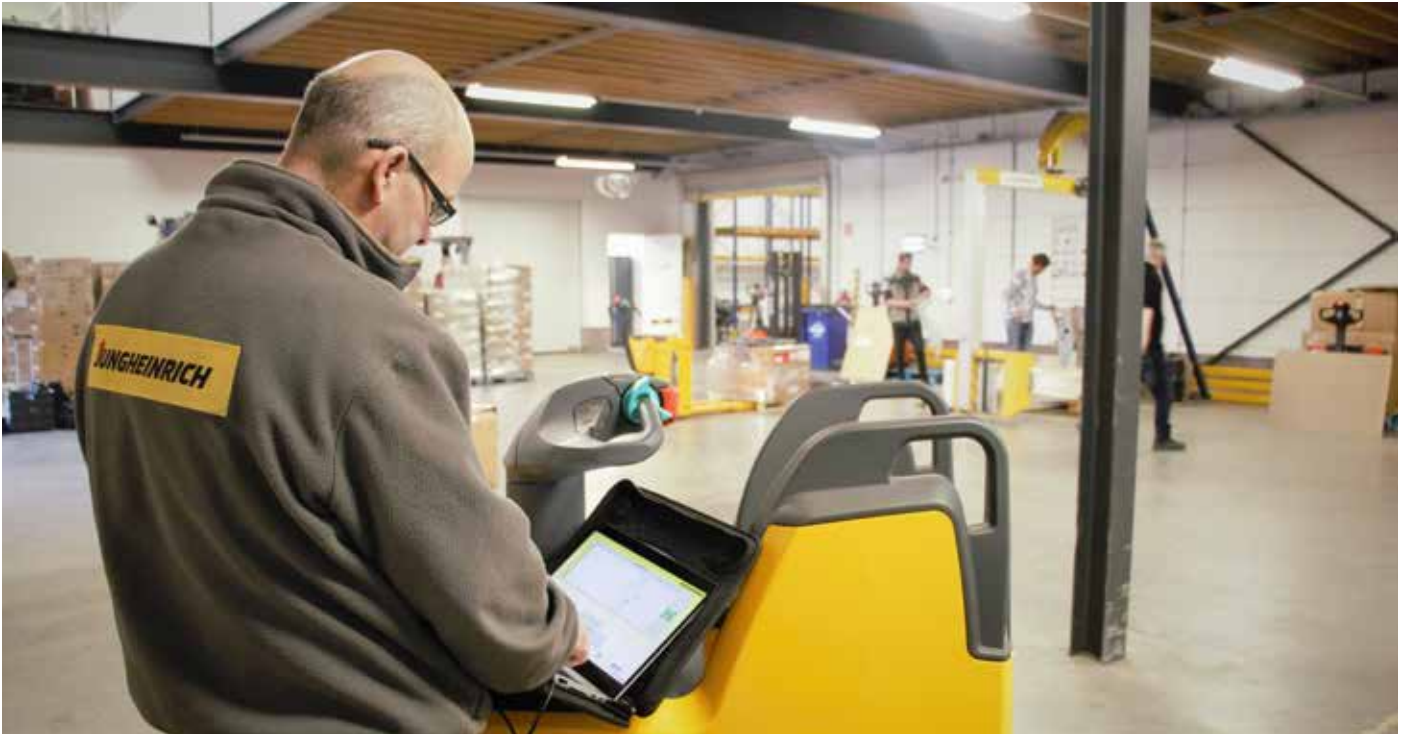
De Jungheinrich servicemonteur komt al jaren bij Werkplein Fivelingo over de vloer. Hij kent het bedrijf, de mensen en de werkzaamheden.

leverde Jungheinrich een elektrische heftruck, een meeloop palletwagen en een elektrische meerrij palletwagen met vast stapplatform en vaste zijwanden, de ERE.