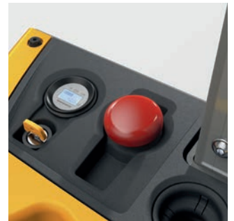
De EJC M. Alle belangrijke bedieningselementen zijn centraal geplaatst: accu-indicatie, draaiurenteller, noodschakelaar en sleutel.