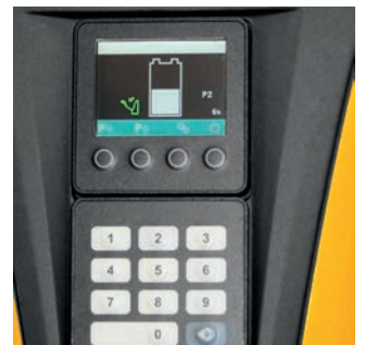
EMC 110: 2"-display inclusief accu-indicatie en draaiurenteller (optioneel).