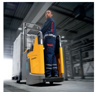
Ruim stapplatform voor maximale ergonomie en veiligheid van de operator. Optioneel met voetbeschermingssensor.