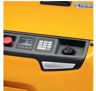
Met geïntegreerde acculader voor snel en eenvoudig tussenladen aan een 230V stopcontact.