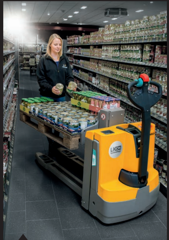
Compact, wendbaar en krachtig, ook in smalle gangpaden: de EMD 115i met de innovatieve lithium-ion accu.