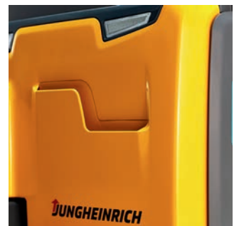
Alles onder één dak – werkdocumenten zijn veilig opgeborgen in de EJC en zijn dus altijd bij de hand.