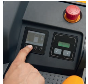
Alle belangrijke parameters altijd in het zicht, bijv. laadstatus of draaiuren.