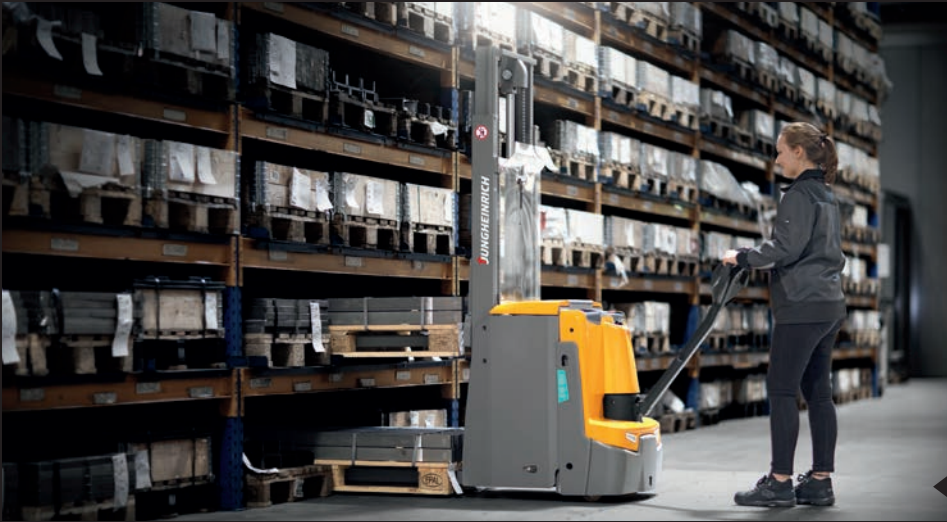
Twee keer zo productief in dezelfde tijd: de EJD 220 kan twee pallets tegelijk opnemen.