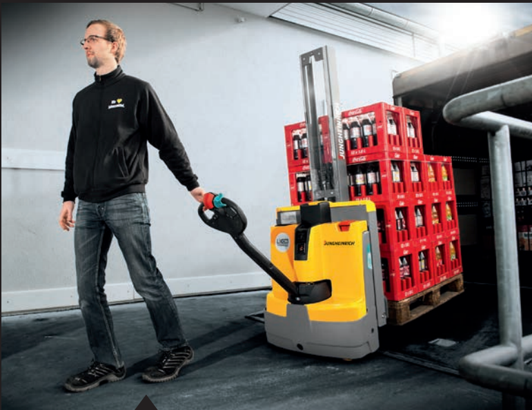
De EMD 115i biedt maximale flexibiliteit en een grotere bodemvrijheid dankzij de geïntegreerde wielarmheffing.